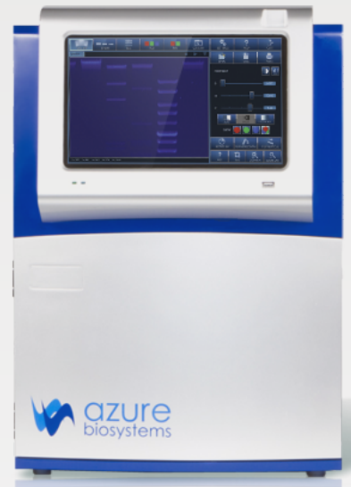
IQ/OQ/PQ 认证用于 c150-c600 成像系统