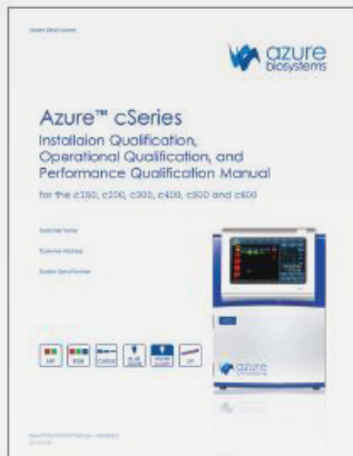
IQ/OQ/PQ 认证规程 包括安装认证、操作认证和性能认证规程

Azure Biosystems IQ/OQ/PQ 认证规程（以下简称 3Q 认证）是验证 Azure 成像系统以及撰写执行标准、标准操作规程和实验室管理等方面文件的基础工具。3Q认证包括规程、清单、靶标板、满足认证所需的证书。