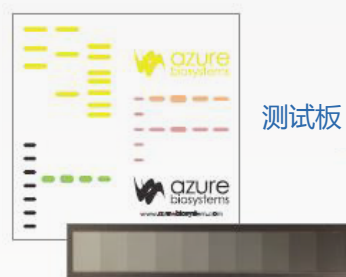
梯度光密度靶标板